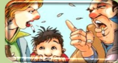
Aile içinde zararlı alışkanlıklar

Koruyucu faktörler ifadesi, risk ya da zorluğun etkisini yumuşatan, azaltan ya da ortadan kaldıran, sağlıklı uyumu ve bireyin yeterliklerini geliştiren durumları tanımlamaktadır.