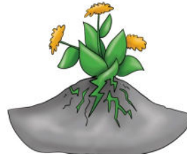
Resim: Sapasağlam durmak....

Psikolojik sağlamlığın gelişiminde, maruz kalınan riskler ve bu