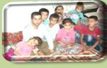
Çocuklar arası yaş farkı olmaması