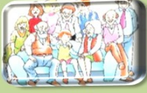
Kalabalık Aile Yapısı